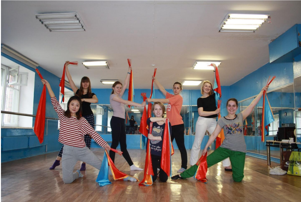
Танец с палочками