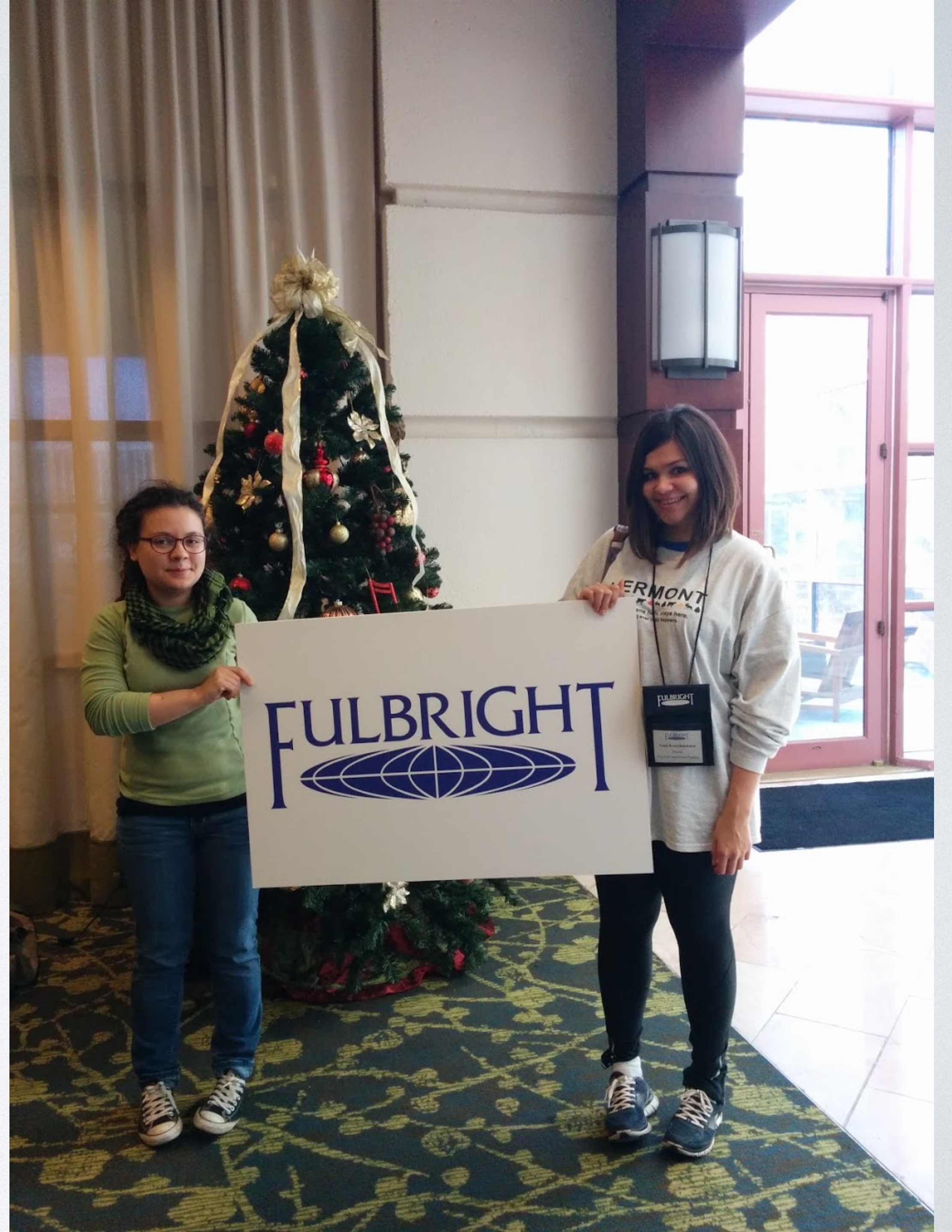
FULBRIGHT ENRICHMENT SEMINAR