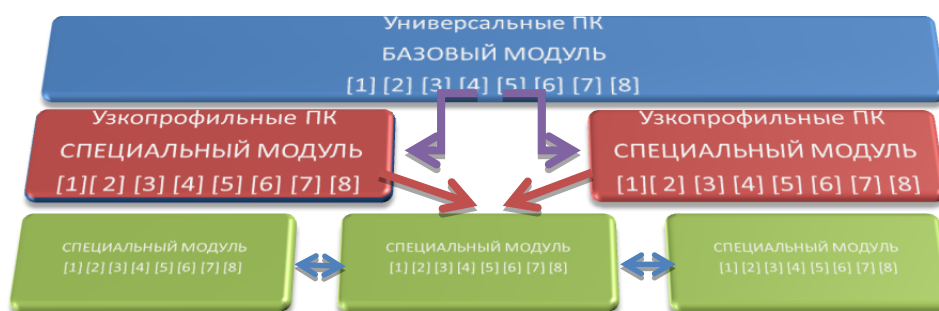
Рис. 2. Моделирование индивидуальной образовательной программы на основе модульного развития профессиональных компетенций

Таким образом, моделирование индивидуальной образовательной траектории студентов на основе алгоритма выводит на принципиально другой подход к разработке учебных программ дополнительного образования: не освоение дополнительного блока знаний, а модульное развитие до требуемого уровня необходимых профессиональных компетенций. Графически этот процесс можно представить следующим образом (рис. 2)