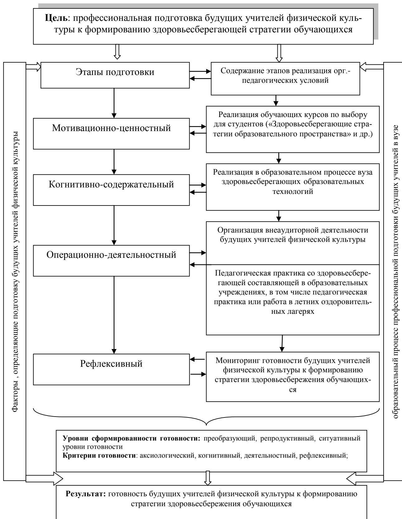
Схема 1. Модель профессиональной подготовки будущих учителей физической культуры к формированию здоровьесберегающей стратегии обучающихся