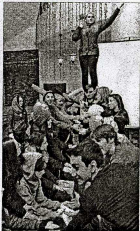
На одном из конкурсов ребята изобразили символ города «Алешу».

После всех тренингов и занятий ребята встретились с представителями национальных объединений. «Мне интересно общаться с людьми разных национальностей, ведь я многого не знаю о их культуре. Это расширяет кругозор, сегодня нам дали шанс лучше узнать традиции и обычаи других народов», - добавила девушка.