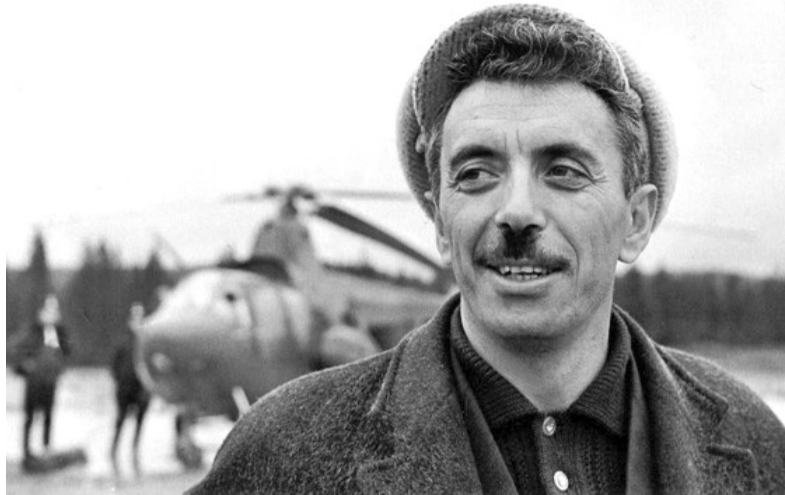
Благодаря Фарману Салманову в округ стал нефтяным сердцем страны.

Всем своим оппонентам Салманов отправил письма одного содержания: «Уважаемый товарищ, в Мегионе на скважине № 1 с глубины 2180 метров получен фонтан нефти. Ясно? С уважением, Фарман Салманов». Оппоненты ответили, что это природная аномалия, что через пару недель скважина иссякнет и что большой нефти в Западной Сибири не может быть. После того, как и из второй скважины в районе Усть-Балыка забил фонтан, Салманов отправил начальству радиogramму: «Скважина лупит по всем правилам», а Никите Хрущёву телеграмму следующего содержания: «Я нашел нефть. Вот так, Салманов». Именно эта история вошла в основу художественного фильма о неф-