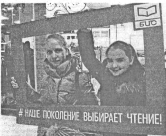
Неделя книги принесла юным книголюбам веселые приключения.

«Вы попались в наши сети!» - эта акция в крупном торговом центре прошла для приверженцев социальных сетей. Подписался на страницу МБУ «БИС» ВКонтакте - получи книгу, а еще ежедневно много интересной информации о книге и чтении в своей ленте. Последствием такого виртуального общения библиотеки с детьми и подростками становится увеличе-