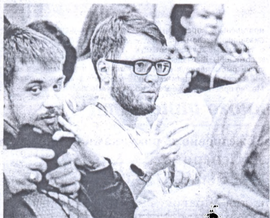
Молодые активно вступили в дискуссию.