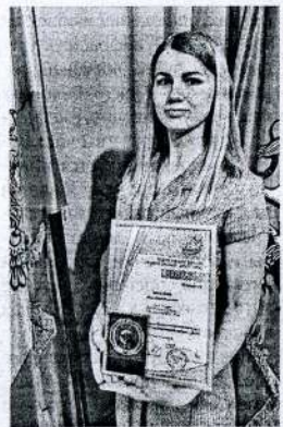
участников из разных регионов страны.

Очный этап Всероссийского конкурса завершился в Москве. В течение четырех дней конкурсанты боролись за звание лучшего в восьми номинациях. В конкурсных мероприятиях приняли участие 123 молодых педагога и 13 наставников. В номинации «Молодой учитель» соревновались 47