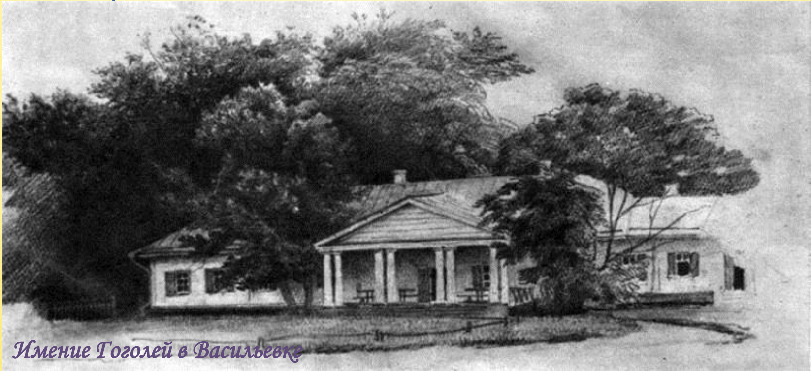
Имение Гоголей в Васильевке

Великий русский писатель родился в местечке Великие Сорочинцы Миргородского уезда Полтавской губернии , в семье помещика. Детские годы Гоголь провел в имении родителей Васильевке . В мае 1821 г. поступил в гимназию высших наук в Нежине . Здесь он занимается живописью, участвует в спектаклях. Пробует себя и в различных литературных жанрах (пишет элегические стихотворения, трагедии, историческую поэму, повесть). Тогда же пишет сатиру «Нечто о Нежине, или Дуракам закон не писан» (не сохранилась).