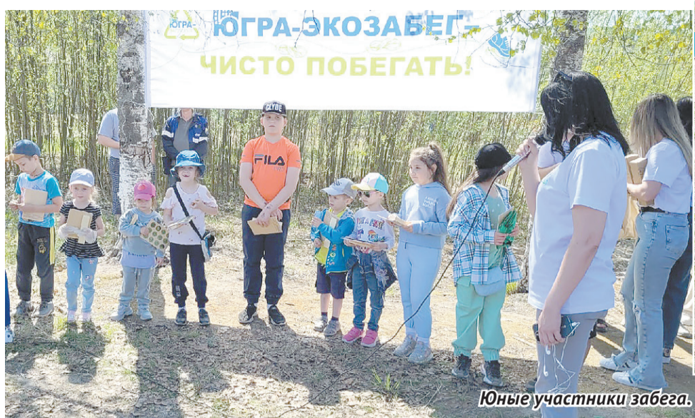
Юные участники забега.

- В этом году во многих населенных пунктах у нас возникла проблема с поиском маршрута - очень чистая территория пробежек, - отметил руководи-