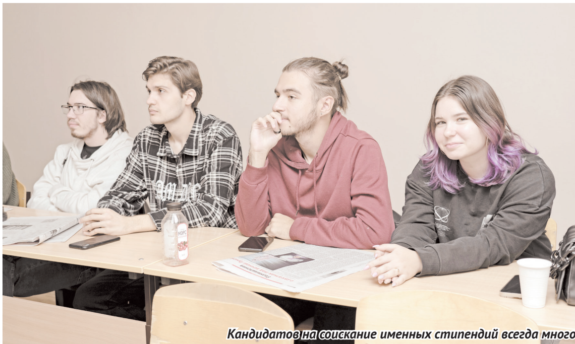
Кандидатов на соискание именных стипендий всегда много.

- Стипендию я, вероятно, получила за отличную учебу и общественную деятельность. В моем активе организация и участие во внутривузовских и городских мероприятиях: