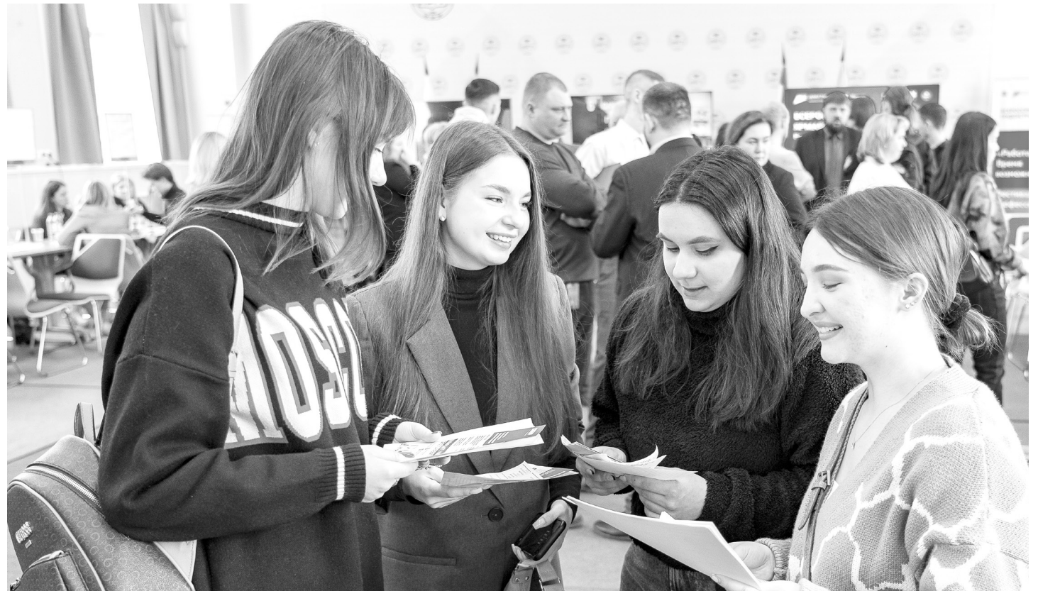
Студенты изучают список вакансий.

- Мы покупаем попутный нефтяной газ, очищаем и продаем. Пропан и бутан отправляем в Тобольск и получаем полимеры - полипропилен и полиэтилен. На наших заводах 3 тысячи рабочих мест. 8% сотрудников ежегодно обновляется. Мы сделали вывод, что нам лучше принимать выпускников учебных заведений. Они приходят с горящими глазами, они еще не разучились учиться. Когда мы принимаем взрослых специалистов, настроить их на работу в нужном нам режиме очень трудоемко, а молодые открыты для учебы. Это хорошее мероприятие для тех, кто ищет работу, для молодых специалистов, - говорят представители компании.