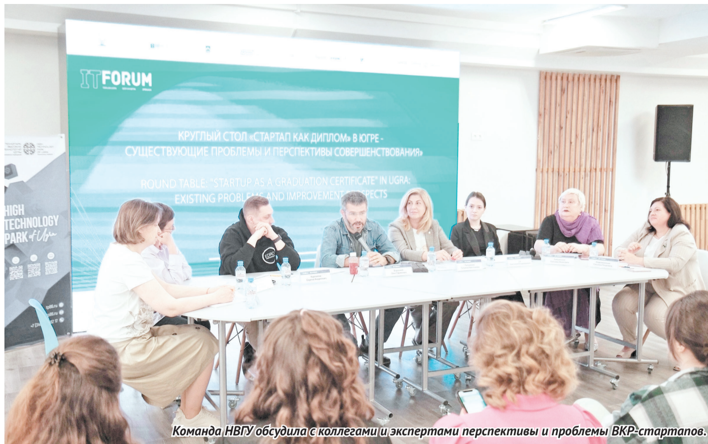
Команда НВГУ обсудила с коллегами и экспертами перспективы и проблемы ВКР-стартапов.

- Само понятие «ВКР-стартап» - это две составляющие. Высшая школа прекрасно знает, что такое ВКР. Мы работаем с документами, знаем регламенты и другое. Эксперты «Сколково» - удивительные практики, они знают, что такое стартап. Знают, как он рождается, как лучше сгенерировать идею, описать ценность предложения и провести его по всем стадиям, чтобы выйти на какой-то конечный продукт. Мы владеем такими знаниями в минимальной степени. При этом эксперты зачастую не имеют представления о нашем регламенте. Очень важно было проговорить все это, чтобы