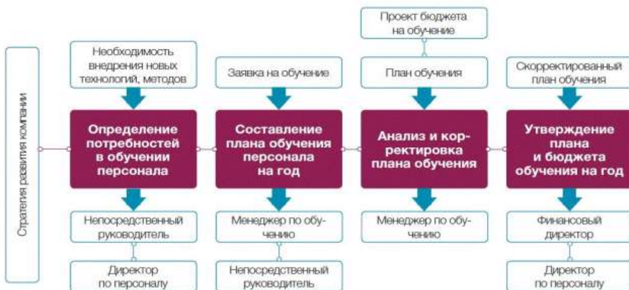
Рис. 1. Система обучения и развития персонала*

* Источник: https://kasheloff.ru/photos/sistema-obucheniya-i-razvitiya-personala-v-organizatsii/30