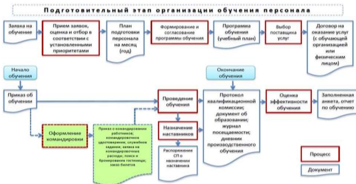
Рис. 2. Процесс организации обучения на предприятии*

На рисунке 2 представлен полный цикл организации обучения персонала. Внимательно изучите, дайте определения всем документам, которые оформляются в результате реализации программы обучения персонала.