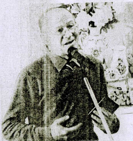
Поездки по России вдохновляют.