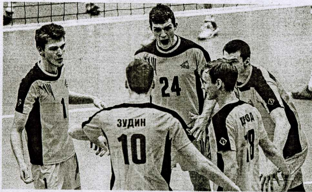
Чемпионат России. Молодежная лига. Первый этап. Итоговая таблица.

Завершился регулярный чемпионат России по волейболу среди команд Молодежной лиги, в которой выступают игроки не старше 23 лет. Нижневартовский «Университет» пробился в шестерку сильнейших и на втором этапе поспорит за медали. Сургутская «Звезда Югры» сыграет в утешительном турнире за 11-14 места.