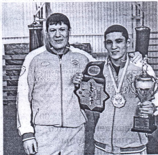
Прославленный боксер и его тренер.