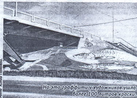
На это граффити у художников ушло более 100 литров краски!

- У нас не было цели превзойти кого-то. Мы просто хотели создать нечто красивое для земляков, - делится художник.