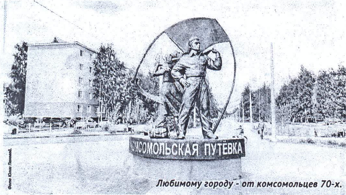
Любимому городу - от комсомольцев 70-х.