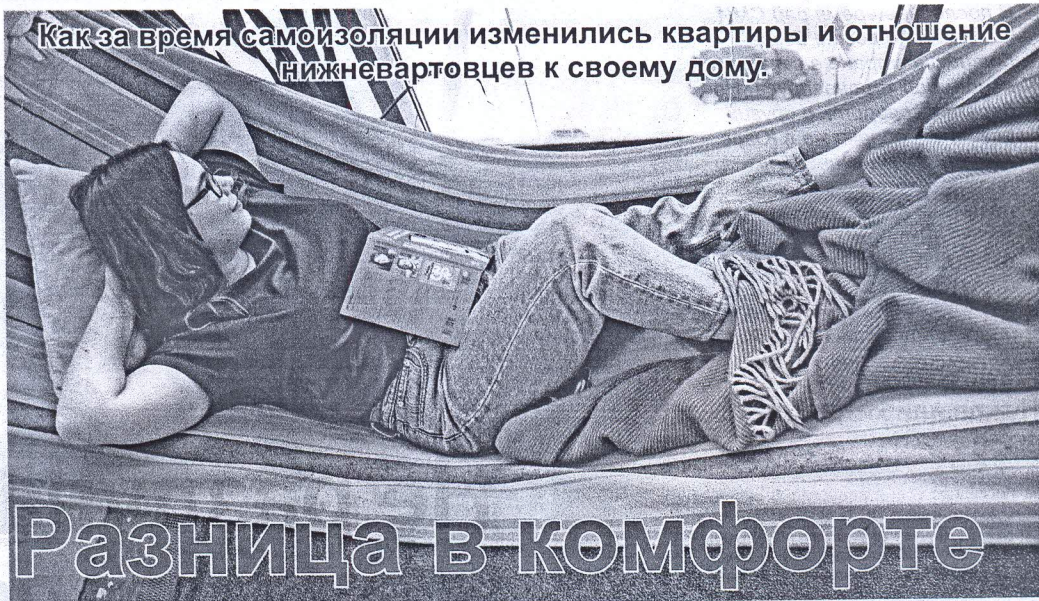
Балкон может заменить отдых на природе.

Свою роль в творческом процессе сыграла домашняя студия, где местные рэперы записывают свои треки. Комната полностью обшита поролоном, внутри минимум мебели и оборудование. Ребята приезжали сюда, как положено, в масках,