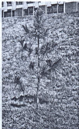
- Услышав об акции, мы обратились в Нижневартовское

Кедровые саженцы предоставила местная компания «Уралтранссервис», специализирующаяся на лесовосстановительных работах для нефтяных предприятий.