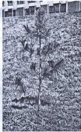
- Услышав об акции, мы обратились в Нижневартовское

Кедровые саженцы предоставила местная компания «Уралтранссервис», специализирующаяся на лесовосстановительных работах для нефтяных предприятий.