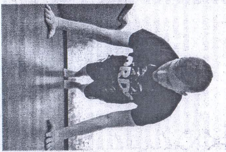
В домашних условиях.