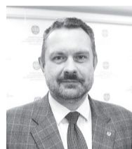
Всеволод Кольцов, заместитель губернатора автономного округа:

На заседании комиссии по охране здоровья и развитию физической культуры и спорта общественной палаты Югры под председательством Александра Громута, обсудили два федеральных законопроекта, направленных на предупреждение распространения COVID-19 в связи с внесением изменений в ФЗ «О санитарно-эпидемиологическом благополучии населения», Воздушный кодекс и Устав железнодорожного транспорта РФ. Александр Громут подчеркнул, что эти законопроекты и деятельность государства не ограничивают прав людей, а защищают их, создают условия для безопасности других.